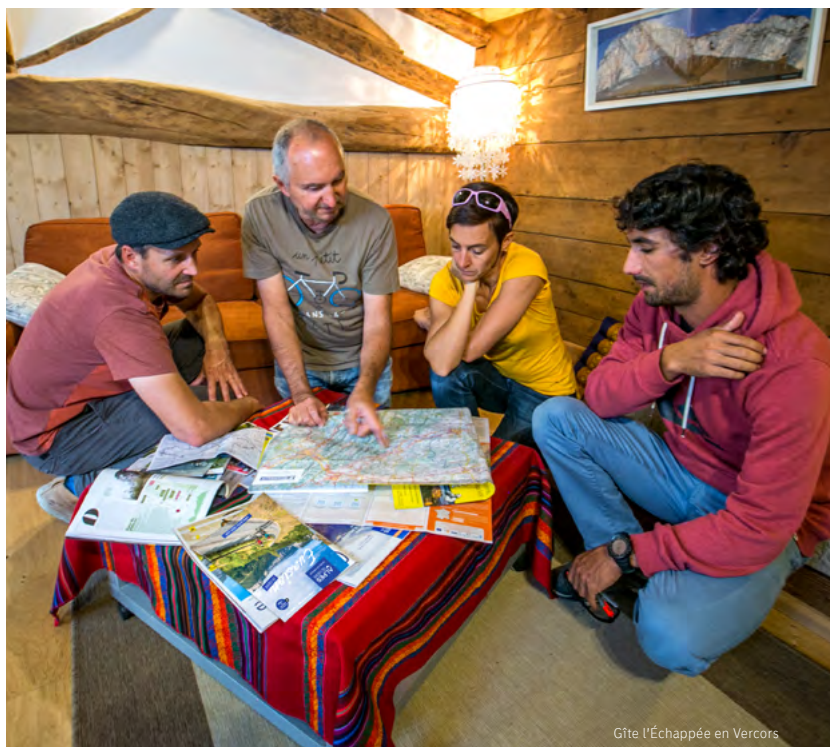
Gîte l'Échappée en Vercors

Dans ce n° 4 de la Tribune d'Isère Attractivité, les socioprofessionnels apportent leur expertise pour illustrer ces axes clés de la stratégie d'Isère Attractivité. Ils nous apportent des regards et témoignages qui nous rappellent combien ces projets s'ancrent dans la réalité.